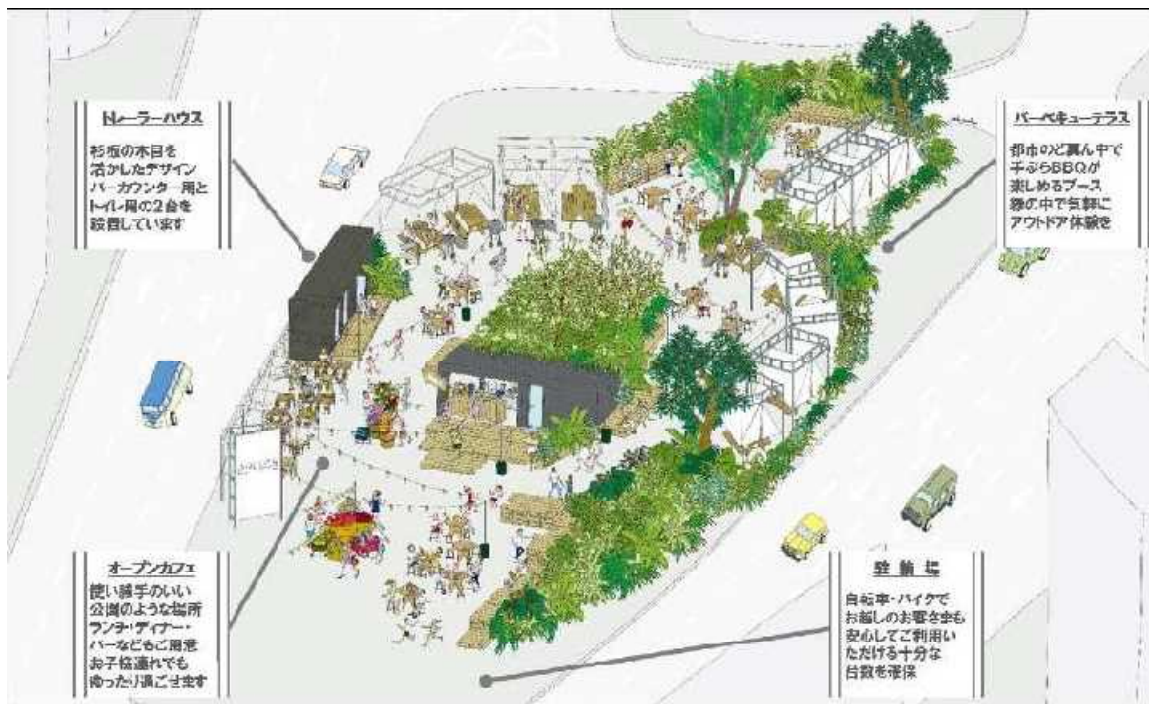
JUNGLE Namba (ジャングルなんば) イメージ