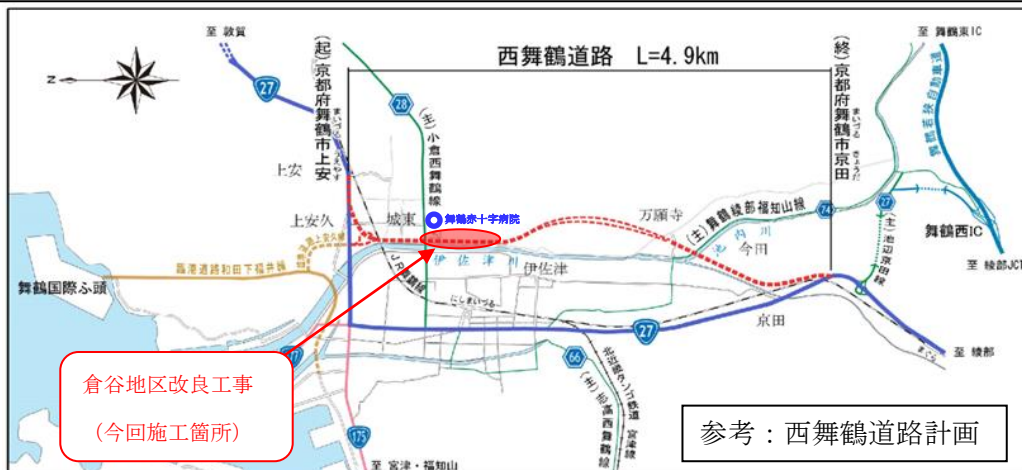
参考：西舞鶴道路計画