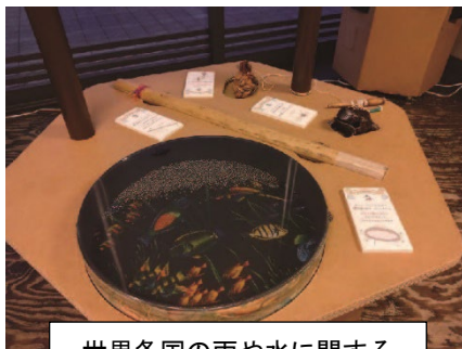
世界各国の雨や水に関する楽器に触れて楽しもう