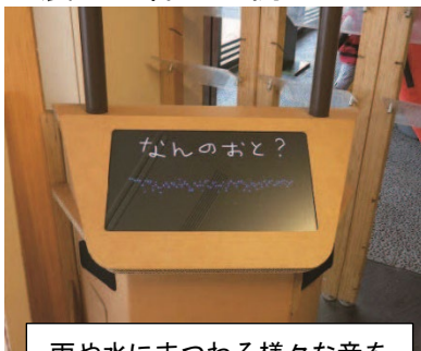
雨や水にまつわる様々な音をクイズ形式で紹介