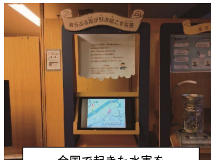
全国で起きた水害を実際の映像を交えながら紹介