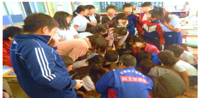
・イベント波及による小学校出前講座(11/20)