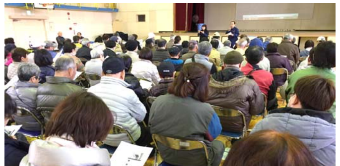
・イベント波及により防災講座の参加者増加(2/24)