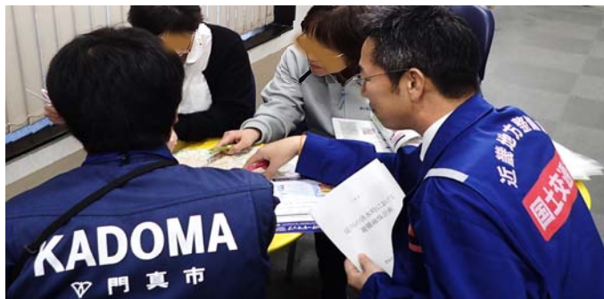
・イベント波及による避難確保計画着手(12/21)