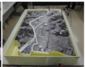
揖保川下流卓上模型

幹事の方々に、実際の川の氾濫の様子を見て貰うために模型に水を流し、実演しました。