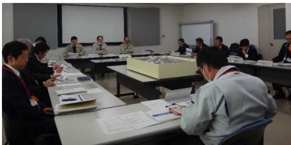
各機関との意見交換