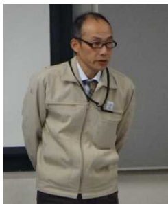
河川管理者の挨拶