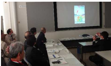
浸水疑似体験ARの紹介