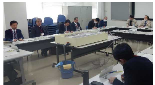
市町からの意見等