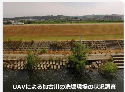
UAVによる加古川の洗掘現場の状況調査

平成30年7月豪雨による加古川の出水に際し、兵庫県小野市河合中町において、堤防法尻の洗掘が発見されたことを受け、応急対策を実施。UAV（ドローン）による被災状況の把握を行い、調査結果から復旧に向けた検討を迅速に進めることが可能となり、一連の復旧工事に貢献。