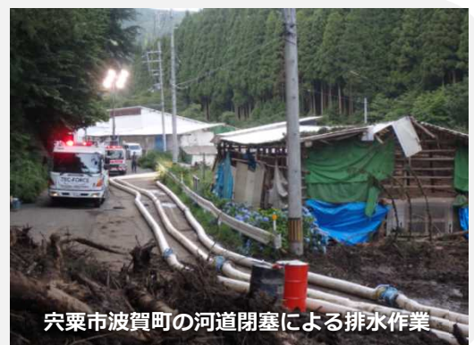
宍粟市波賀町の河道閉塞による排水作業

兵庫県宍粟市波賀町道谷（県道大屋波賀線48号）で発生した地滑りに伴う河道閉塞箇所の排水作業を昼夜継続して実施し、生活道路でもある地方道の早期復旧に貢献。