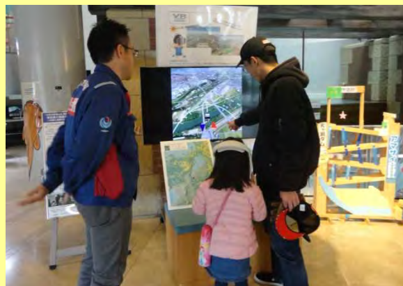
土日限定でVR体験会も実施