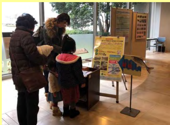
アクア琵琶クイズラリーを同時開催