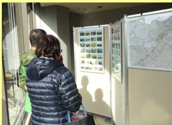
展示を見る来場者