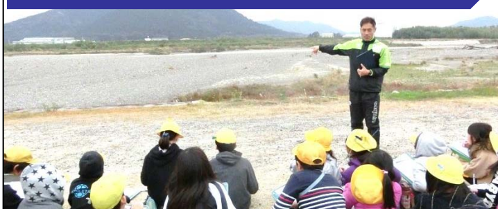
川の流れや水の力及び水の力による働きを授業