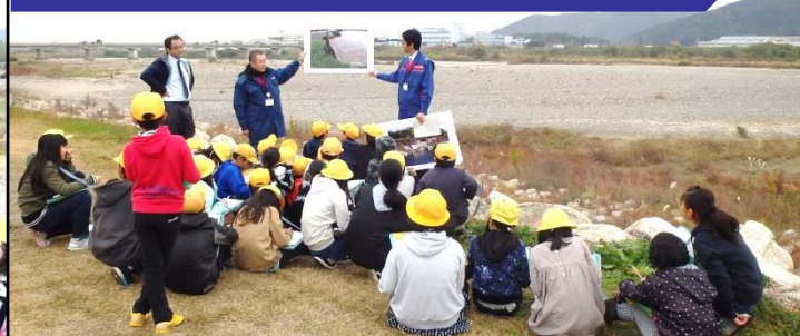
H27年度、H29年度の台風による洪水で被災した状況説明