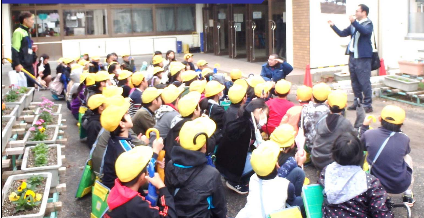
50センチぐらいの浸水深があり、今のように座っていると水没してしまう。駐車場の車も浸かる事を説明