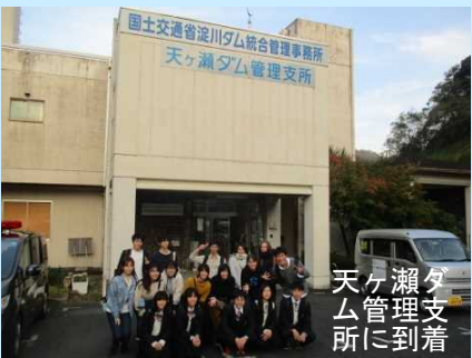
天ヶ瀬ダム管理支所に到着