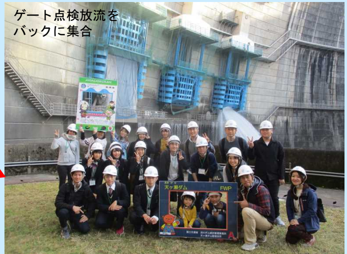
ゲート点検放流をバックに集合