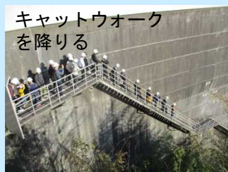
キャットウォークを降りる