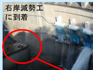
右岸減勢工に到着