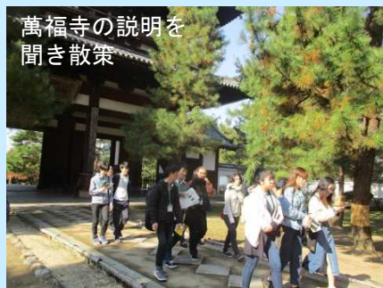
萬福寺の説明を聞き散策