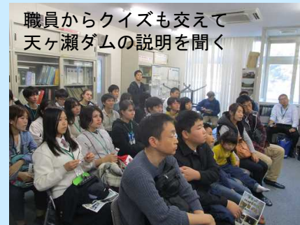
職員からクイズも交えて天ヶ瀬ダムの説明を聞く