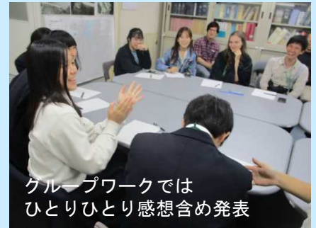
グループワークではひとりひとり感想含め発表