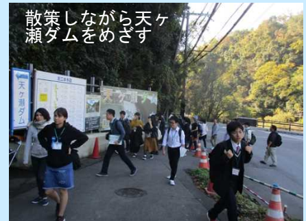
散策しながら天ヶ瀬ダムをめざす