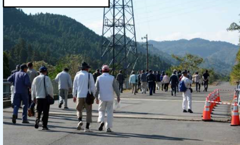
大鳥居橋にて事業効果等を説明