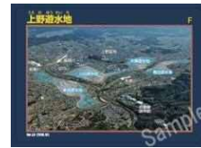
【上野遊水地】カード