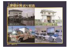
【上野遊水地巡り記念】カード