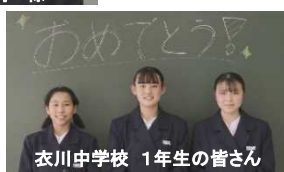
衣川中学校 1年生の皆さん