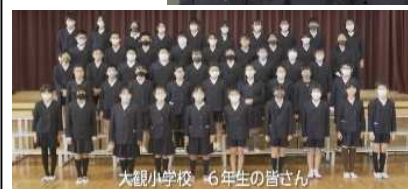
大観小学校 6年生の皆さん

まちづくり大観地区協議会会長や、地元の小中学生より感謝と期待のお言葉を頂きました。