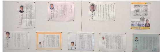
（上段左から）西村衆議院議員、末松参議院議員、片山参議院議員、加田参議院議員 （下段左から）清水参議院議員、伊藤参議院議員、高橋参議院議員、佐藤参議院議員、足立参議院議員