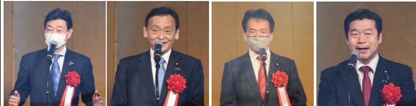
西村衆議院議員 末松参議院議員 片山参議院議員 加田参議院議員