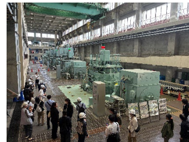
毛馬排水機場見学