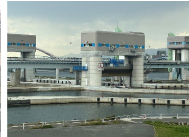
淀川ゲートウェイ通航