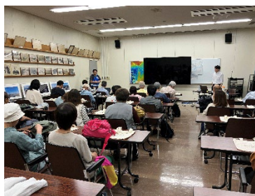
毛馬出張所での事業概要説明