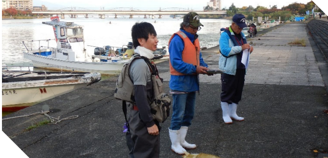
特定外来生物の除去作業（瀬田川左岸73.8k付近）