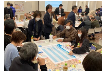
綾部市 活動報告 青野町での水害等避難行動タイムライン作成

流域界を基本とし府域を10のブロックに分割し、ブロック毎に大規模水害時の広域避難計画を検討