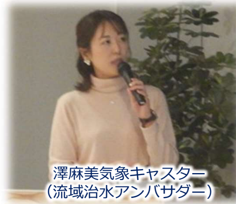
澤麻美気象キャスター （流域治水アンバサダー）