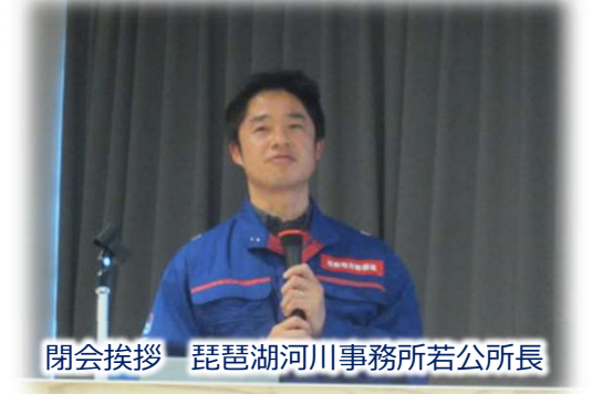
閉会挨拶 琵琶湖河川事務所若公所長