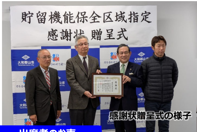
感謝状贈呈式の様子