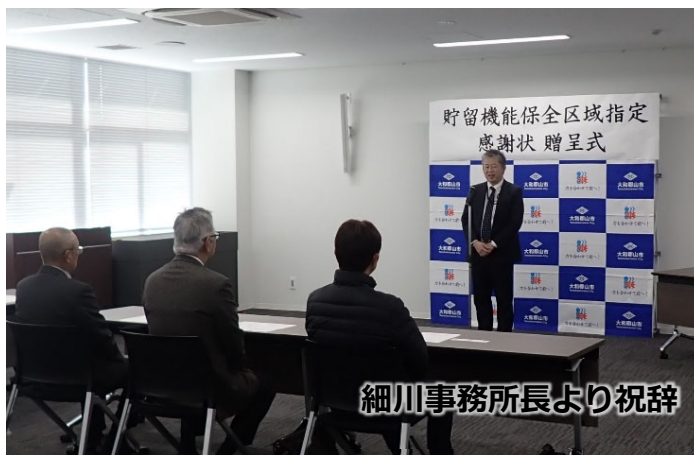
細川事務所長より祝辞

「今回の区域指定で浸水被害の軽減に貢献できればと思っている。昨年より制度について丁寧に説明いただいた国、県、市には改めて感謝したい。」