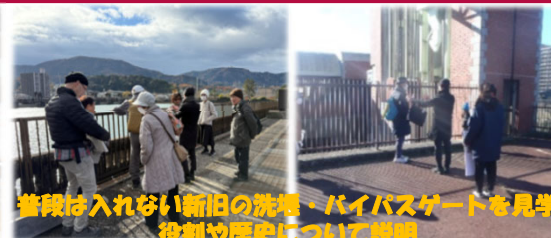
普段は入れない新旧の洗堰、パイプゲートを見学 役割や歴史について説明