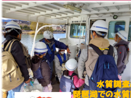
水質調査船「湖水守」で、 琵琶湖での水質調査と作業方法を体験