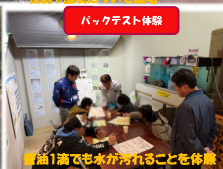
醤油1滴でも水が汚れることを体験