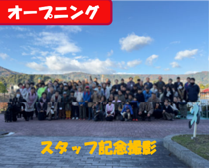
スタッフ記念撮影