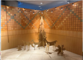
DIYダンボール工作 クリスマスver