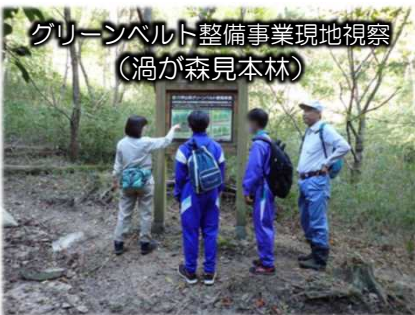
グリーンベルト整備事業現地視察 （渦が森見本林）