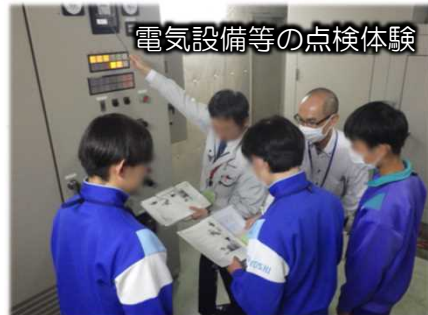
電気設備等の点検体験