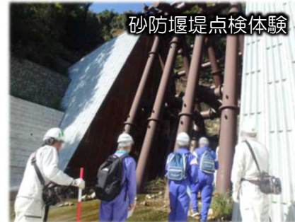
砂防堰堤点検体験