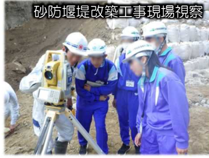
砂防堰堤改築工事現場視察