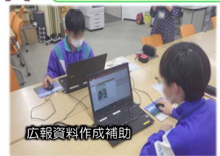
広報資料作成補助