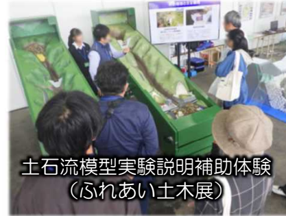
土石流模型実験説明補助体験 （ふれあい土木展）