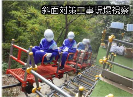
斜面对策工事現場視察