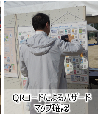
QRコードによるハザードマップ確認