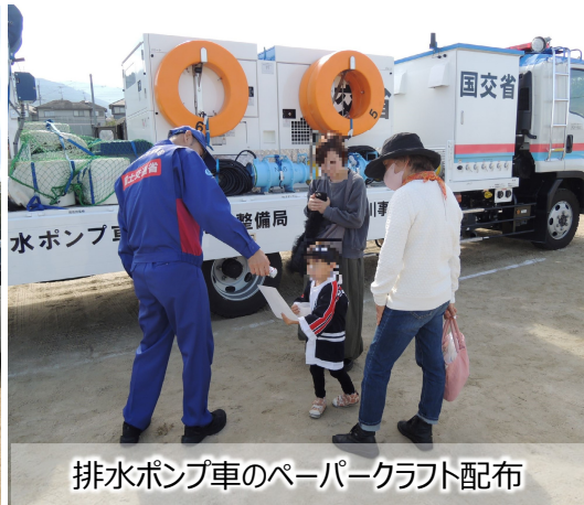
排水ポンプ車のペーパークラフト配布