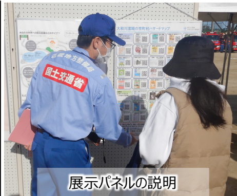
展示パネルの説明