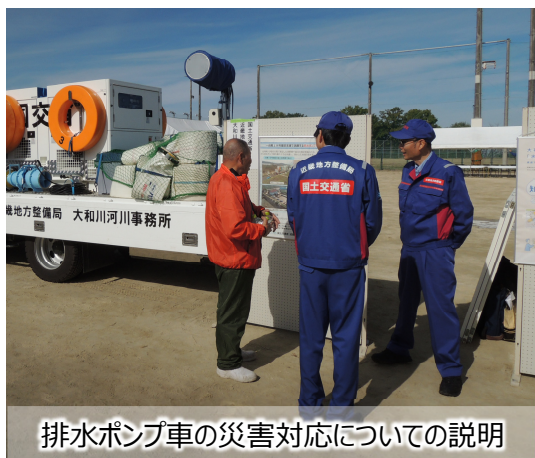
排水ポンプ車の災害対応についての説明