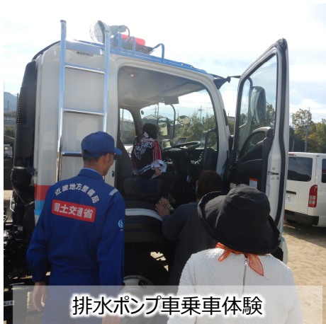
排水ポンプ車乗車体験