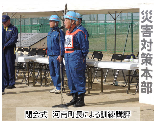
閉会式 河南町長による訓練講評