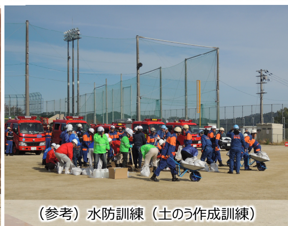
(参考) 水防訓練 (土のう作成訓練)