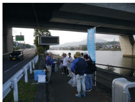
今から清掃活動を始めます