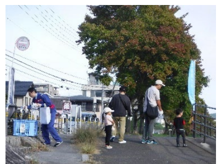
みんなできれいに