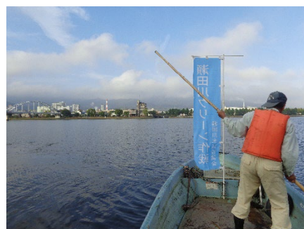
水面のゴミは船から回収しました