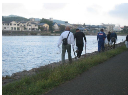
瀬田川ぐるりさんぽ道のゴミも回収しました