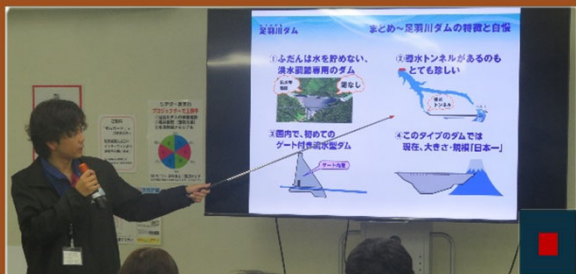
▲足羽川ダム建設事業について説明