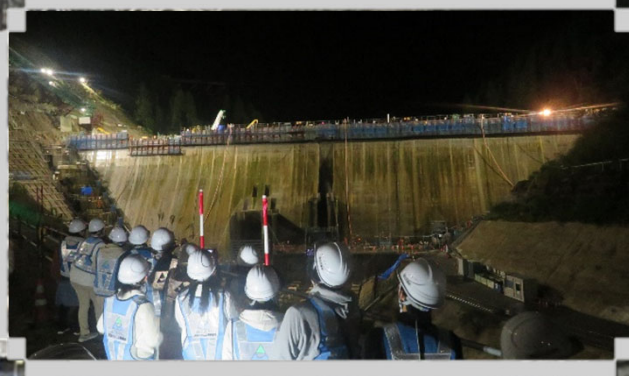
▲ダム本体の状況をダム上流側から見学

事業加速化の契機となった福井豪雨から20年、現在、ダム建設の最盛期を迎えております。