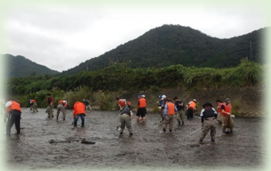
人力で耕うん作業を行います