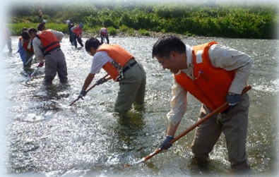
じょれん等を使って参加者みんなで耕します