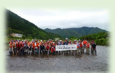
今年で6年目！63名が参加しました