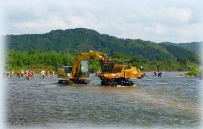
川幅が広いので重機も使って作業