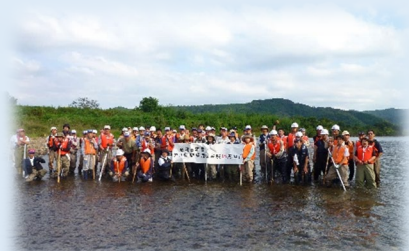
今年で4年目！73名が参加しました