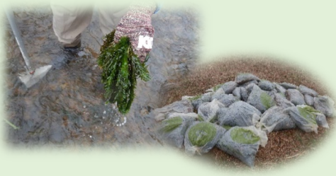
アユの餌となる付着藻類の生長を阻害する 外来植物オオカナダモの駆除