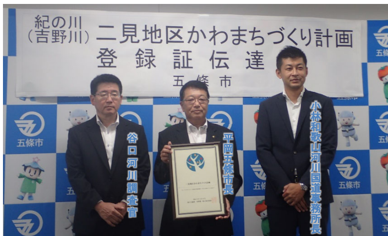
「かわまちづくり計画」登録を伝達