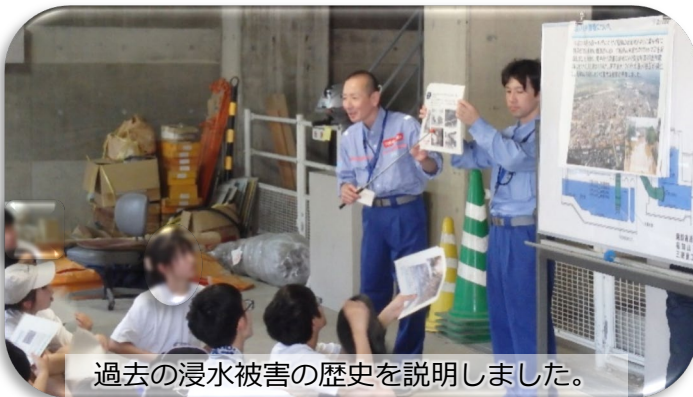
過去の浸水被害の歴史を説明しました。