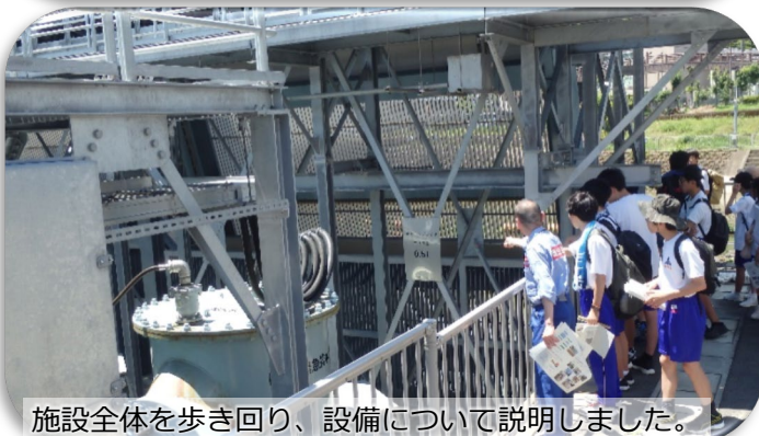
施設全体を歩き回り、設備について説明しました。