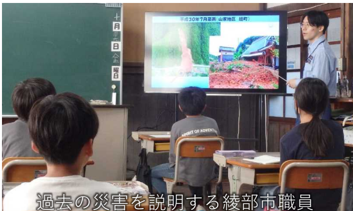
過去の災害を説明する綾部市職員