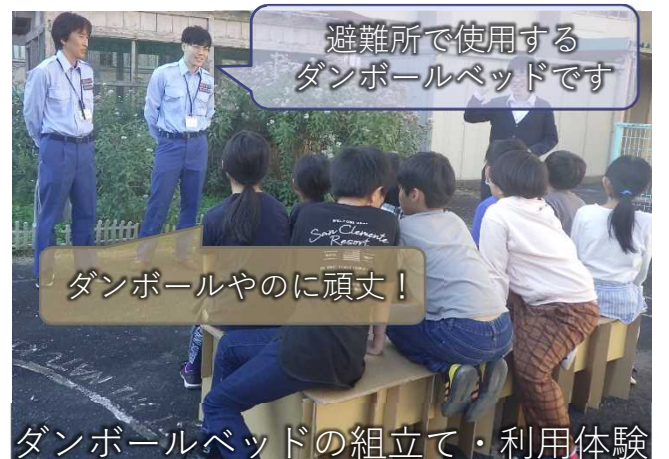
ダンボールベッドの組立て・利用体験