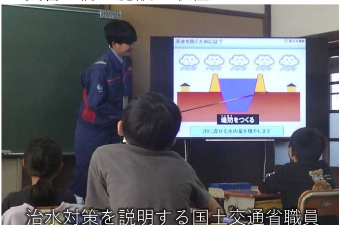
治水対策を説明する国土交通省職員