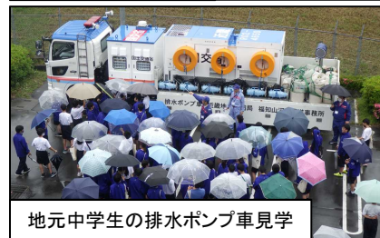
地元中学生の排水ポンプ車見学