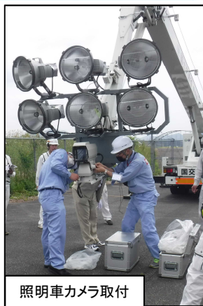
照明車カメラ取付