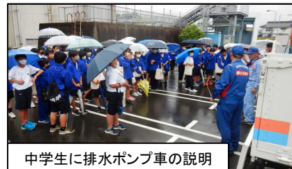
中学生に排水ポンプ車の説明