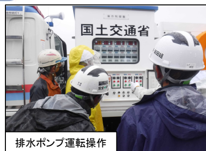
排水ポンプ運転操作