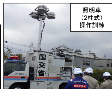
照明車 (2柱式) 操作訓練