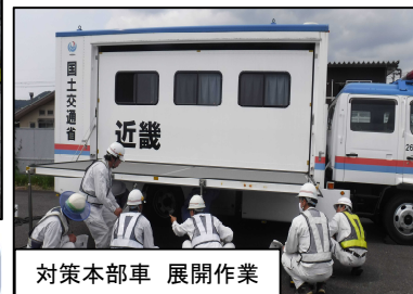
対策本部車 展開作業