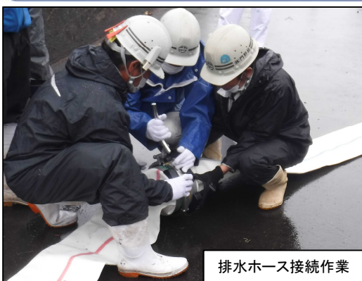
排水ホース接続作業