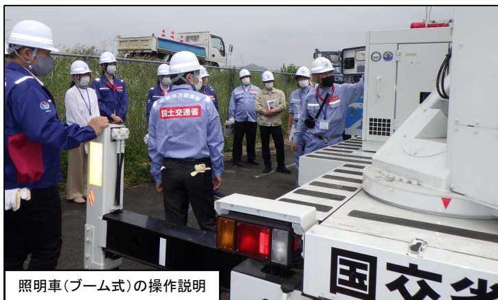
照明車(ブーム式)の操作説明