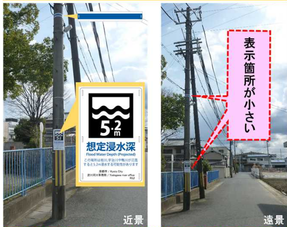
標準的なまるごとまちごとハザードマップ