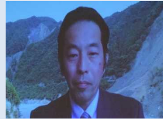
竹林 洋史 京都大学 防災研究所 准教授