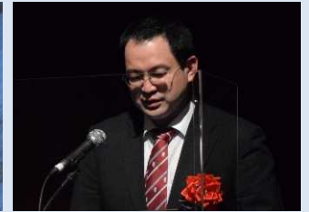
木下 篤彦 国土技術政策総合研究所 主任研究官