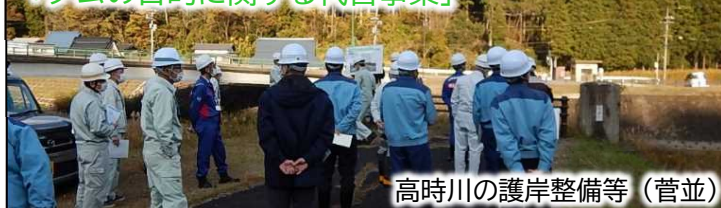
高時川の護岸整備等（菅並）