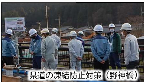
県道の凍結防止対策（野神橋）