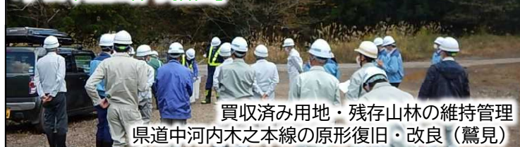
買収済み用地・残存山林の維持管理 県道中河内木之本線の原形復旧・改良（鷺見）