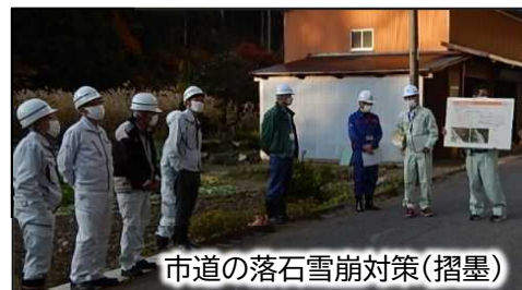
市道の落石雪崩対策（摺墨）