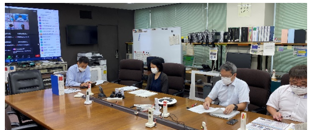
<協議会の様子(猪名川河川事務所)>