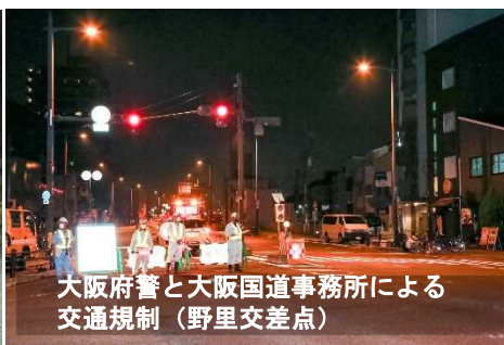
大阪府警と大阪国道事務所による交通規制（野里交差点）

防潮鉄扉の閉鎖訓練は、鉄道や幹線国道等の通行止めを伴うため、本番さながらの訓練を年に1度実施しています。今年は、新型コロナウイルス感染防止対策に配慮した上で、訓練を実施しました。