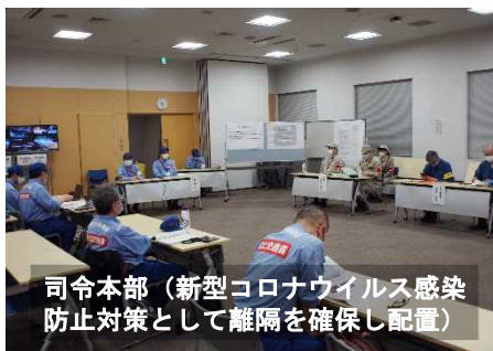
司令本部（新型コロナウイルス感染防止対策として隔離を確保し配置）