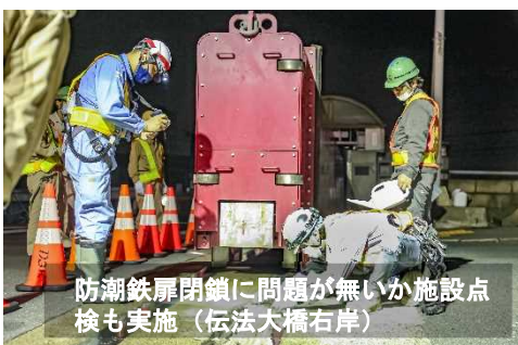
防潮鉄扉閉鎖に問題が無いか施設点検も実施（伝法大橋右岸）