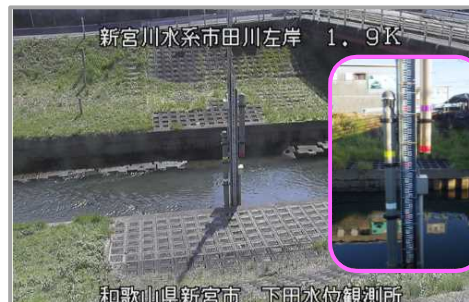
市田川 下田地点 下田水位観測所カメラ (下田水位観測所)