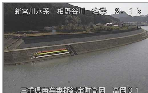
相野谷川 高岡地点 高岡01カメラ (高岡地区輪中堤)