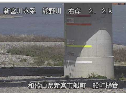
熊野川 成川地点 船町樋管カメラ (熊野大橋橋脚)

今回の設置により、紀南河川国道事務所の管理する熊野川(成川)・市田川(下田)・相野谷川(高岡)の3箇所で「避難目安の水位ライン」の設置が完了しました。