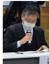
石上 林野庁 兵庫森林管理署長