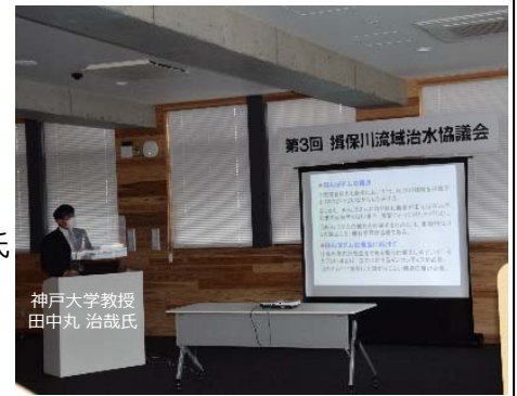
神戸大学教授 田中丸 治哉氏