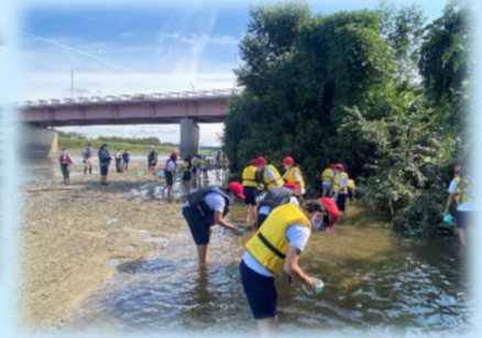
ざるを使って小さい生き物を探します。