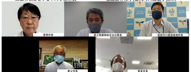
オンラインによるWEB会議