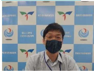
開会の挨拶をする中川事務所長