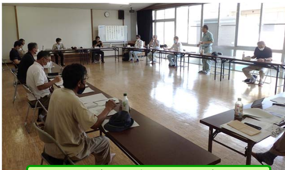
大戸川の水害の歴史とダムの役割について