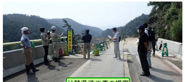
付替県道工事の視察