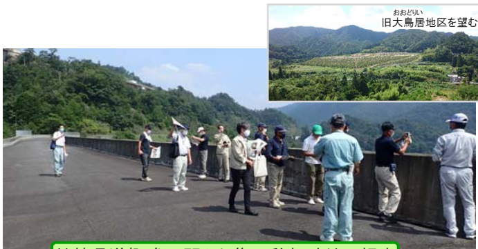
付替県道概成区間から集団移転跡地の視察