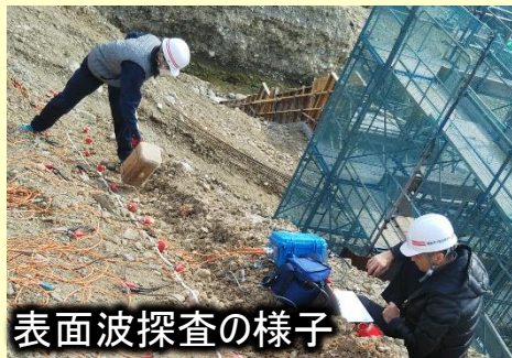
表面波探査の様子

堤防の非破壊調査の研究を進める近畿大学理工学部社会環境工学科の河井准教授からも協力を得て調査を進めています。