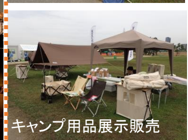
キャンプ用品展示販売