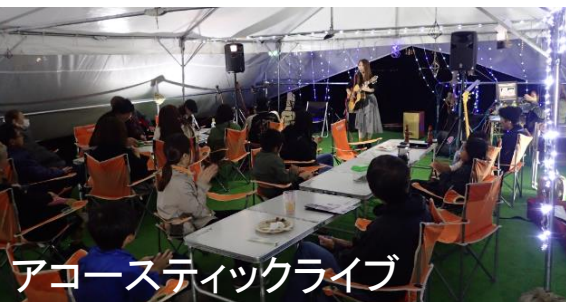
アコースティックライブ