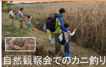
自然観察会でのカニ釣り