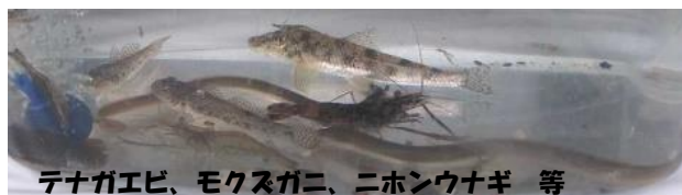
テナガエビ、モクスガニ、ニホンウナギ 等