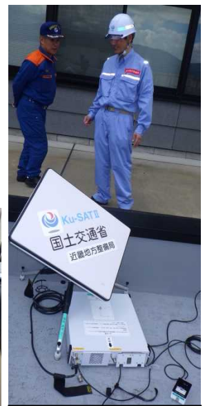
アンテナ設置方法の説明(大野市)