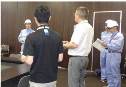
訓練概要の説明状況(勝山市)