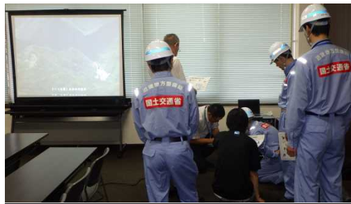
本局より災害映像受信状況(勝山市)