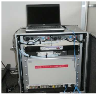
機器設置状況(大野市)