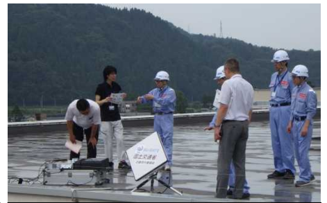
アンテナ設置方法の説明(勝山市)