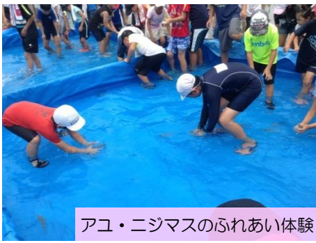
アユ・ニジマスのふれあい体験