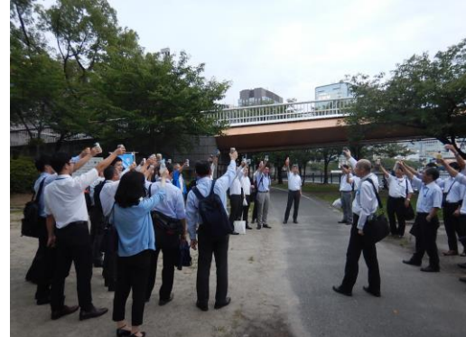
川崎橋をバックに乾杯！