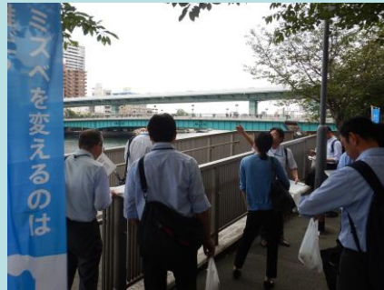
天満橋の解説を交えウォーキング