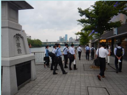
水都大阪の拠点となる八軒家浜