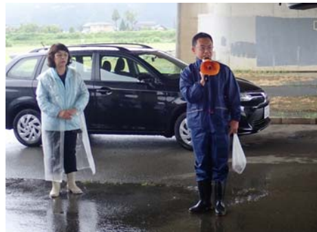
【伊藤事務所長の挨拶】