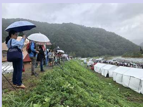
【雨の中応援する観客】