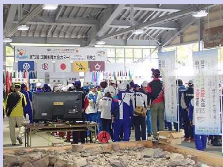
【カヌー競技開会式の様子】