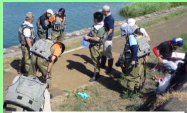
職員によるライフジャケット装着説明

※8/29(水)は「琵琶湖河川ゼミナール」として滋賀県立大学 准教授 野間 直彦氏を講師にお迎えし、現地において外来水生植物の効果的な駆除方法や選別方法についてご指導頂きました。