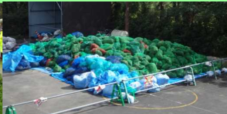
除去したオオバナミズキンバイ (4日間で約13t)