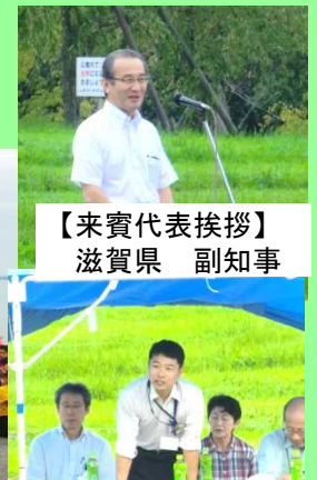
【来賓代表挨拶】 滋賀県 副知事