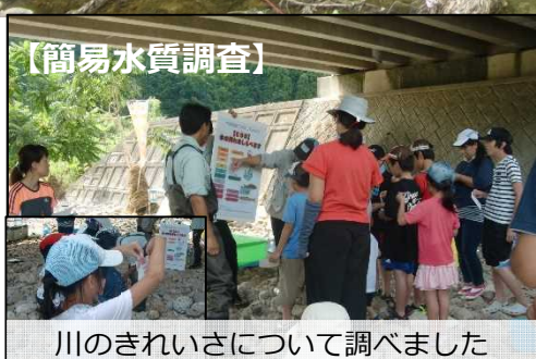
川のきれいさについて調べました