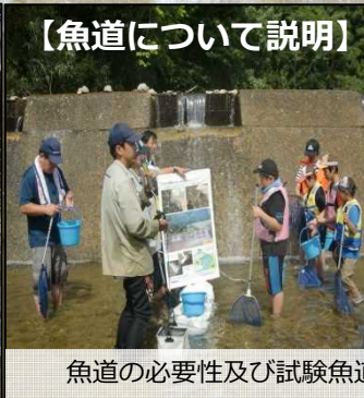
魚道の必要性及び試験魚道による遡上の様子を確認