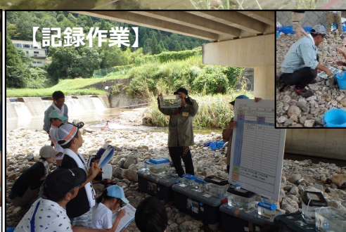
お魚図かんでとれたお魚を確認