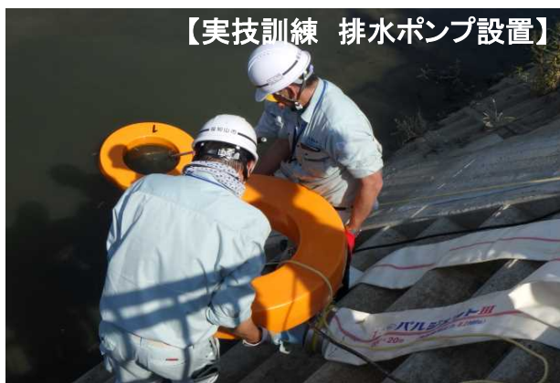
【実技訓練 排水ポンプ設置】