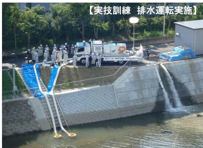
【実技訓練 排水運転実施】