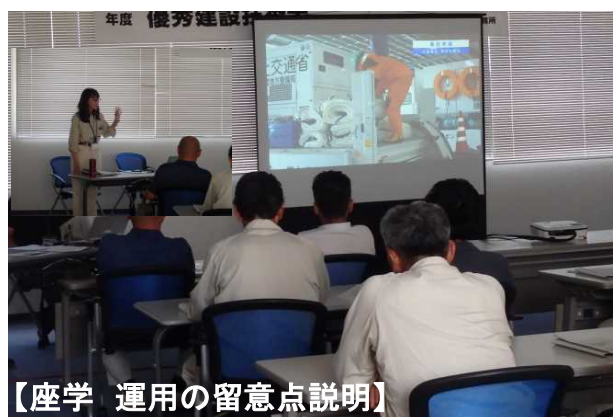
【座学 運用の留意点説明】