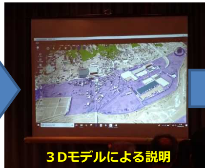
3Dモデルによる説明