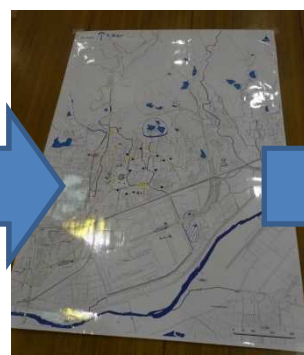
作成した防災マップ