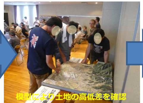
模型により土地の高低差を確認