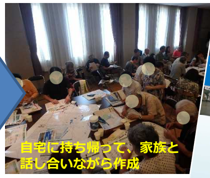
自宅に持ち帰って、家族と話し合いながら作成