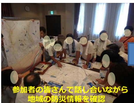
参加者の皆さんで話し合いながら地域の防災情報を確認