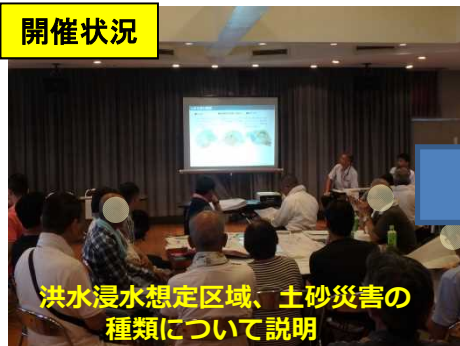
洪水浸水想定区域、土砂災害の種類について説明