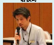
福井河川国道事務所